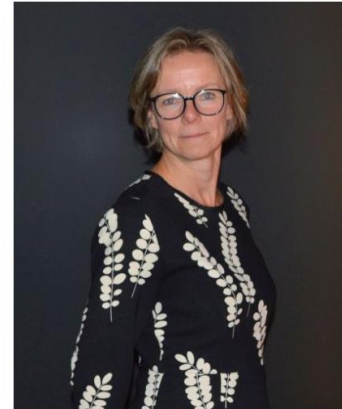
Verslaggeving Crommen Kathleen